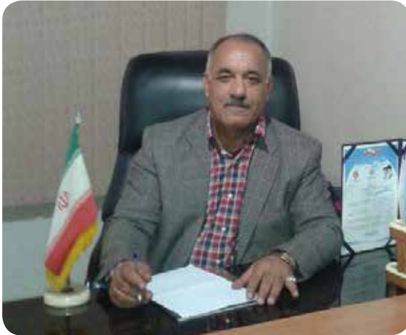
رئیس هیئت مدیره اتحادیه سراسری صنعت دامپروری همگام کشور مطرح کرد: